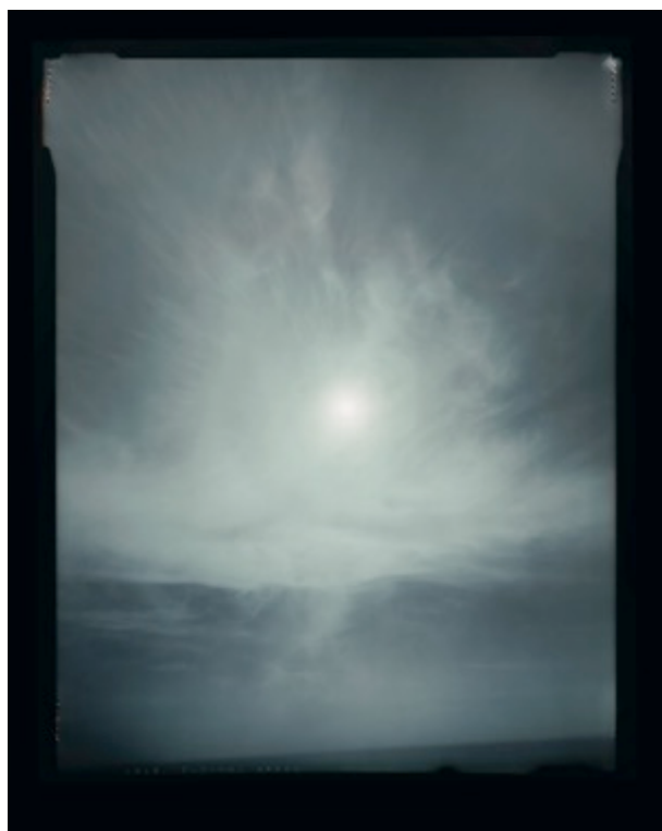
Héliographies #29 Dimensions 95 x 120 cm Tirage couleurs chromogène Jean Gabriel Lopez