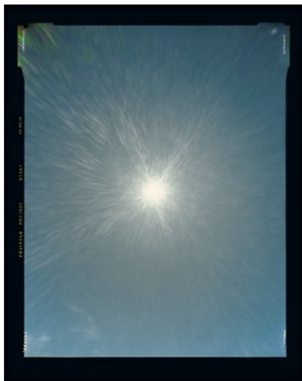
Héliographie #137 Dimensions 95 x 120 cm Tirage couleurs chromogène Jean Gabriel Lopez