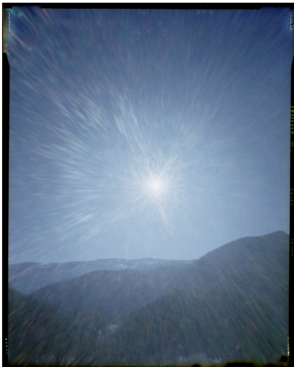
Série Héliographies #68

exposition du 11 avril au 19 mai 2017 sur rendez-vous uniquement