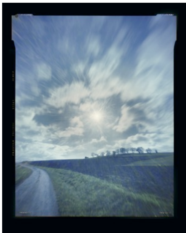
Héliographie #130 Dimensions 95 x 120 cm Tirage couleurs chromogène Jean Gabriel Lopez